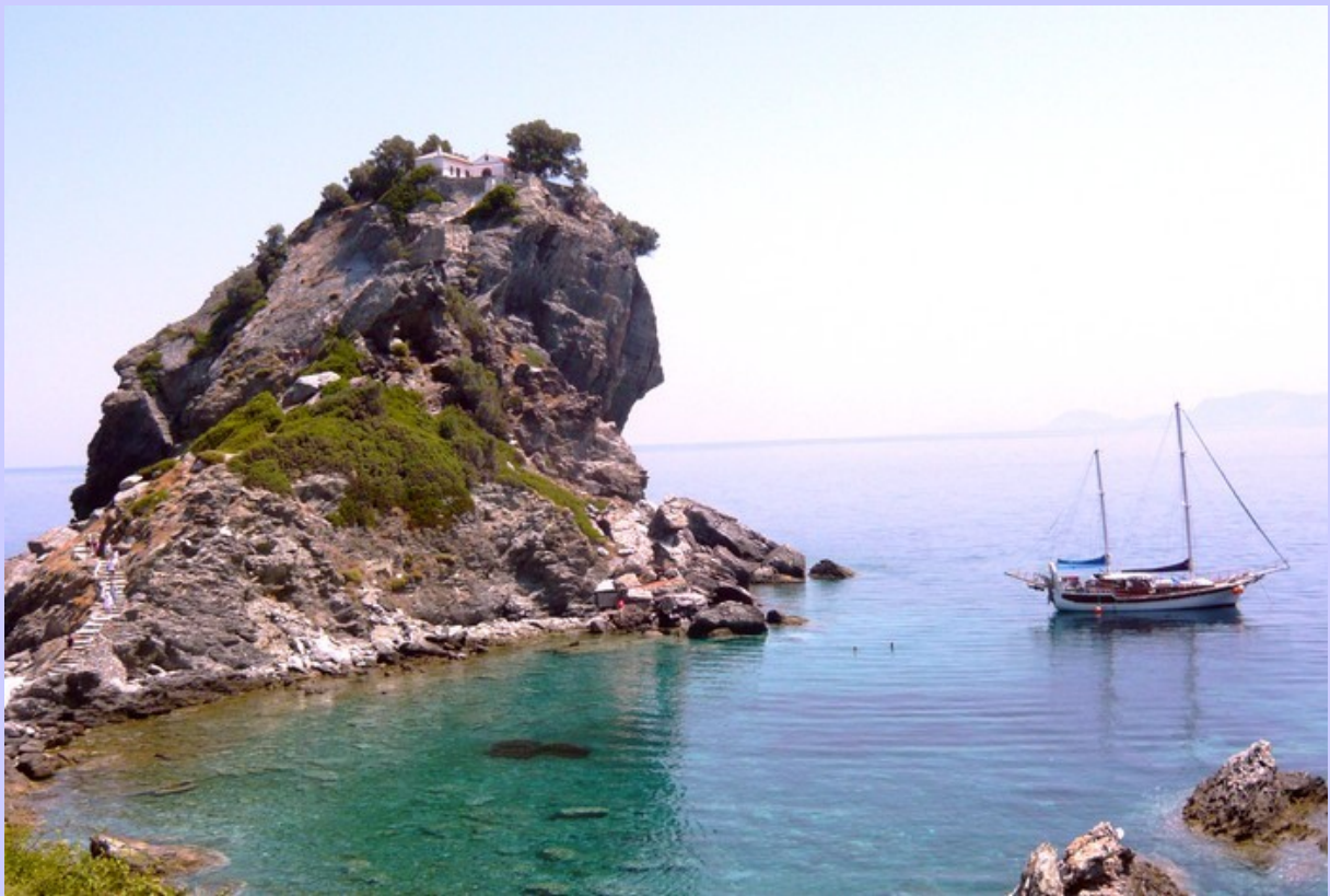
L'ANATOLIE à l'ancre sous l'église de "Mamma mia"

En demi-pension, pas de facturation au bar : boissons de base à libre disposition et possibilité d'amener ou acheter vos propres bouteilles. Le petit-déjeuner et un repas copieux à base de produits frais vous sont servis en demi-pension (apéritif et vins locaux compris).